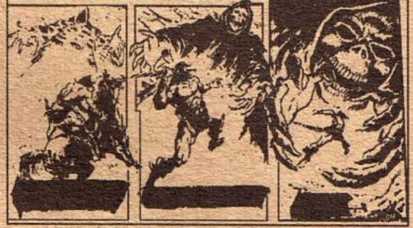
resim altı galliard 8 pt

olsa bu olsa. Yusuf Ziya...ciddiye Duruşu güzeldi. Yüzü renkliydi. Sevgilimin gözleri kısık ve ela. Mustafa Kemal kaşları. İncecik vücudu. Özlemek. Delirmek.