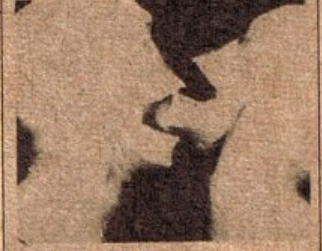
X-ray Series #1, by James Barrett and Robert Forster (London), from the exhibition Don't Leave Me This Way.

acquisitions based in Toob both open to The McG sored by Developme University Queensland different pro